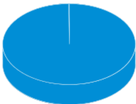
Risco do Ativo

■ Não Classificado 99,94 % ■ Outros 0,06 %