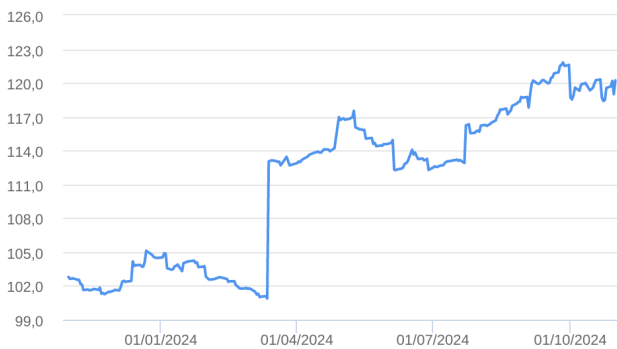
Patrimônio Líquido (R$ Milhões) - 31/10/2023 a 31/10/2024 (diária)