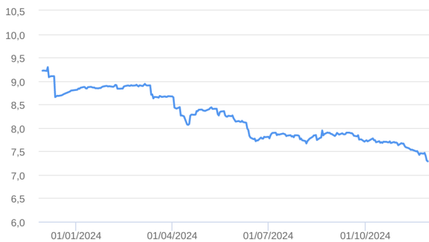
Patrimônio Líquido (R$ Milhões) - 30/11/2023 a 29/11/2024 (diária)