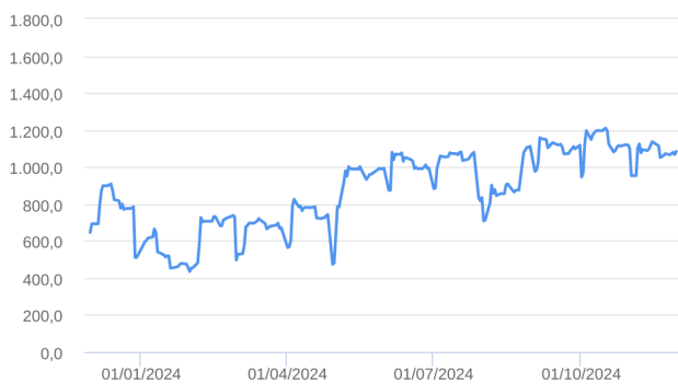
Patrimônio Líquido (R$ Milhões) - 30/11/2023 a 29/11/2024 (diária)