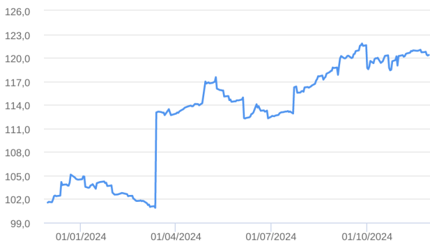
Patrimônio Líquido (R$ Milhões) - 30/11/2023 a 29/11/2024 (diária)