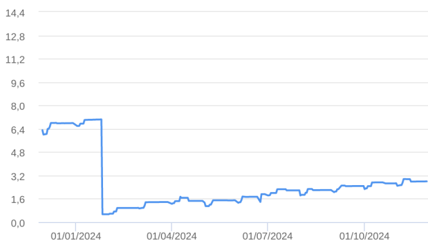
Patrimônio Líquido (R$ Milhões) - 30/11/2023 a 29/11/2024 (diária)