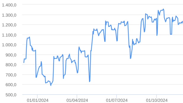
Patrimônio Líquido (R$ Milhões) - 30/11/2023 a 29/11/2024 (diária)