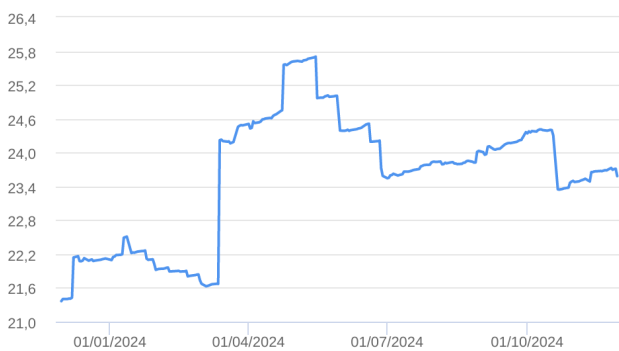
Patrimônio Líquido (R$ Milhões) - 30/11/2023 a 29/11/2024 (diária)