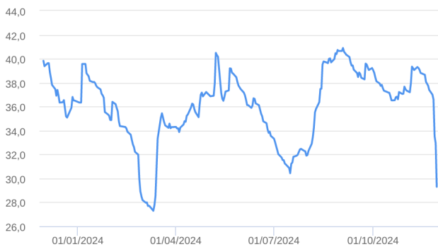
Patrimônio Líquido (R$ Milhões) - 30/11/2023 a 29/11/2024 (diária)