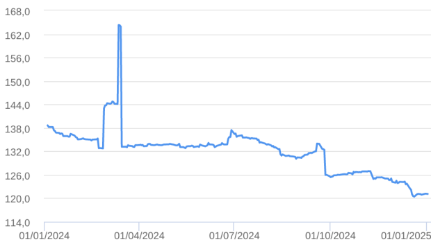
Patrimônio Líquido (R$ Milhões) - 04/01/2024 a 02/01/2025 (diária)