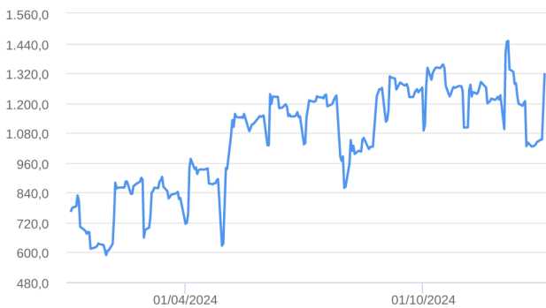
Patrimônio Líquido (R$ Milhões) - 04/01/2024 a 02/01/2025 (diária)