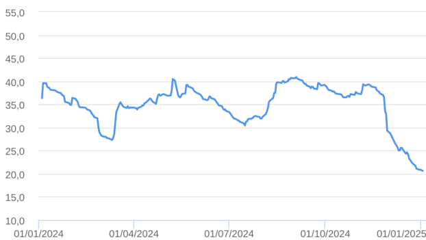
Patrimônio Líquido (R$ Milhões) - 04/01/2024 a 02/01/2025 (diária)