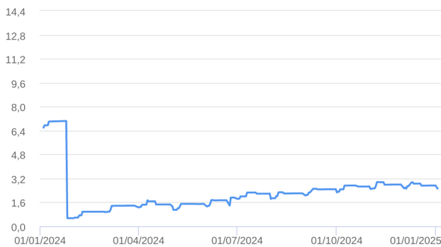
Patrimônio Líquido (R$ Milhões) - 04/01/2024 a 02/01/2025 (diária)