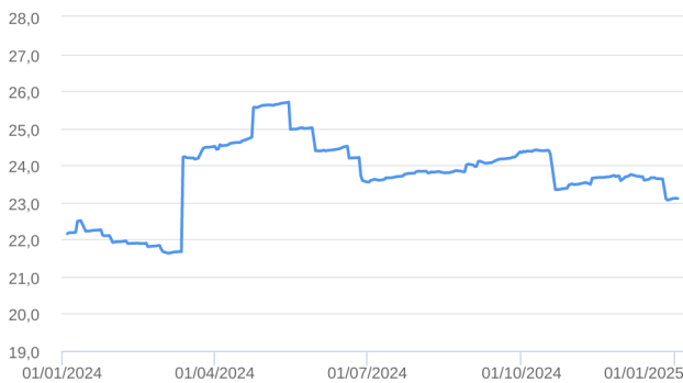
Patrimônio Líquido (R$ Milhões) - 04/01/2024 a 02/01/2025 (diária)