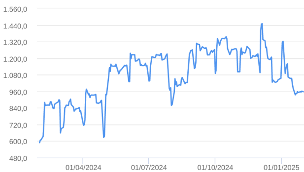
Patrimônio Líquido (R$ Milhões) - 31/01/2024 a 31/01/2025 (diária)