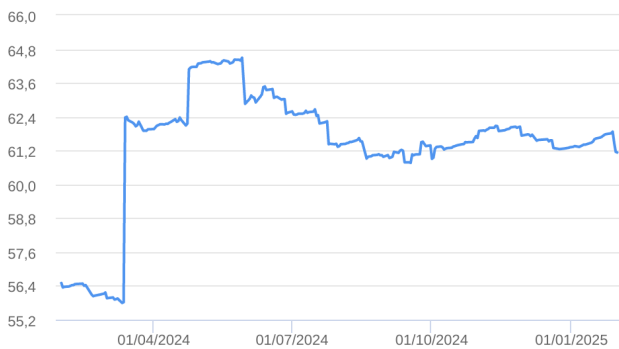
Patrimônio Líquido (R$ Milhões) - 31/01/2024 a 31/01/2025 (diária)