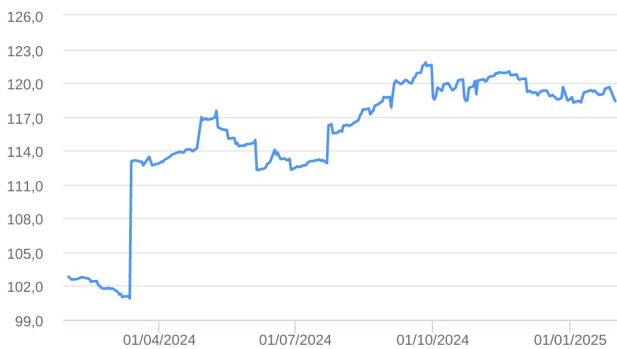
Patrimônio Líquido (R$ Milhões) - 31/01/2024 a 31/01/2025 (diária)