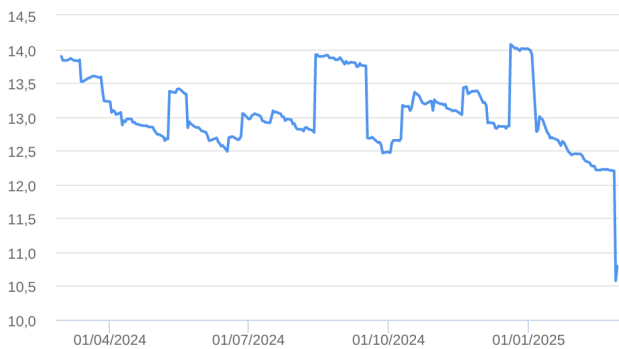
Patrimônio Líquido (R$ Milhões) - 29/02/2024 a 28/02/2025 (diária)