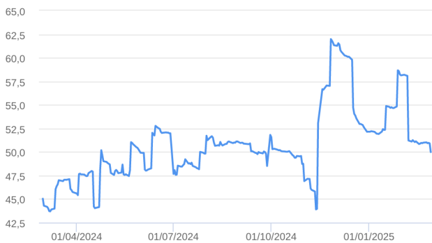
Patrimônio Líquido (R$ Milhões) - 29/02/2024 a 28/02/2025 (diária)