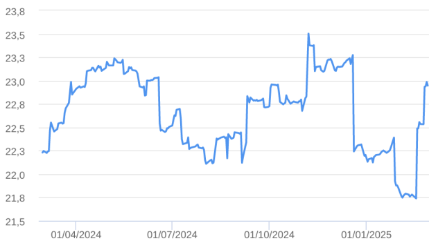
Patrimônio Líquido (R$ Milhões) - 29/02/2024 a 28/02/2025 (diária)