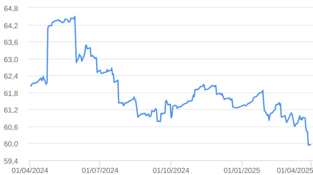
Patrimônio Líquido (R$ Milhões) - 02/04/2024 a 31/03/2025 (diária)